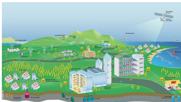
Smart grids (monitoraggio e controllo adattivo)

Attualmente la società è impegnata nella messa a punto di un sistema per la gestione intelligente di parchi eolici, e nella messa a punto di un controllo intelligente dei flussi di potenza ( smart grids ) per evitare fenomeni di saturazione nelle reti elettriche.